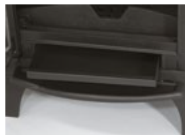
Cajón cenicero extraíble para facilitar la limpieza. Removable ash pan for easy cleaning. Gaveta de cinzas extraível para fácil limpeza.