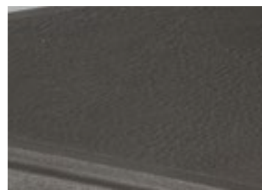
Detalle textura techo. Roof texture detail. Detalhe da textura do tampo.