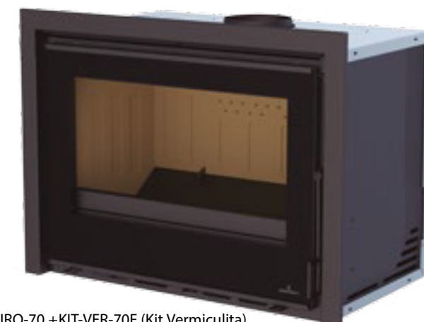
CAIRO-70 +KIT-VER-70F (Kit Vermiculita) Interior en vermiculita Vermiculite interior - Interior em vermiculite.

OPCIONAL KIT-AIR-5: Kit con patas regulables en altura y toma de aire externo. Para convertir en estanco. OPTIONAL KIT-AIR-5: Kit with height adjustable legs and external air intake. For hermetic system. KIT-AIR-5 OPCIONAL: Kit com pés reguláveis em altura e entrada de ar exterior. Para passar a estanco.