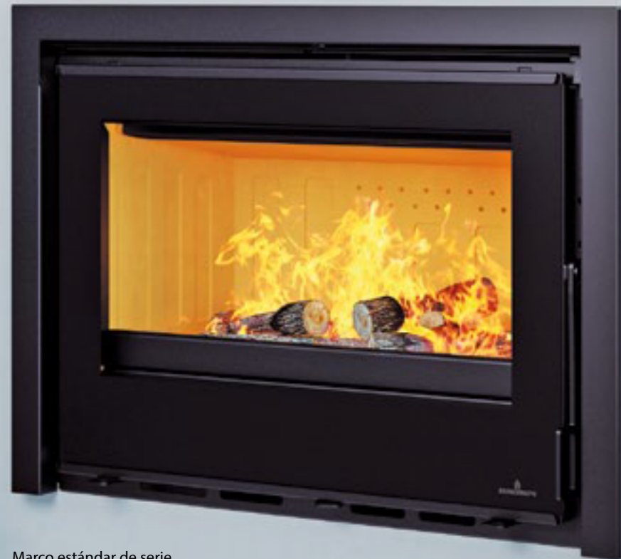
Marco estándar de serie Standard frame included Moldura standart de série

Facilidad de acceso a la turbina desde la cámara de combustión. Ease of access to the turbine from the combustion chamber. Facilidade de acesso à turbina a partir da câmara de combustão.