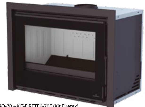
CAIRO-70 +KIT-FIRETEK-70F (Kit Firetek) Interior en Firetek. Firetek interior - Interior em Firetek.