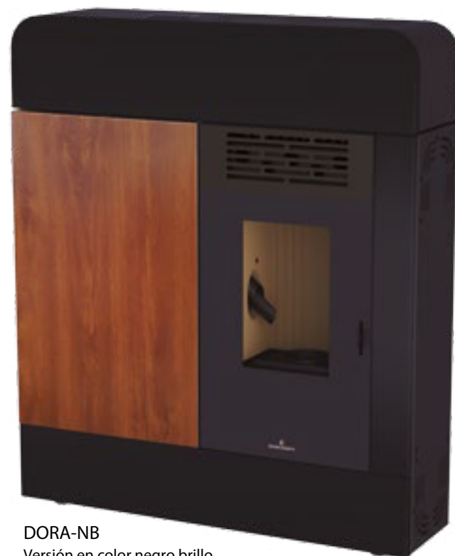
DORA-NB Versión en color negro brillo. Version in gloss black color. Versão na cor preta brilho.