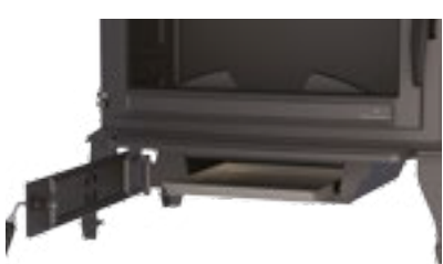
Cajón cenicero extraíble para facilitar la limpieza. Removable ash pan for easy cleaning. Gaveta de cinzas extraível para fácil limpeza.