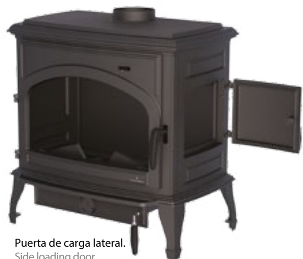
Puerta de carga lateral. Side loading door. Porta de carga lateral.