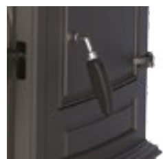
Maneta tipo manos frías. Handle type cold hands. Puxador tipo mãos frias.