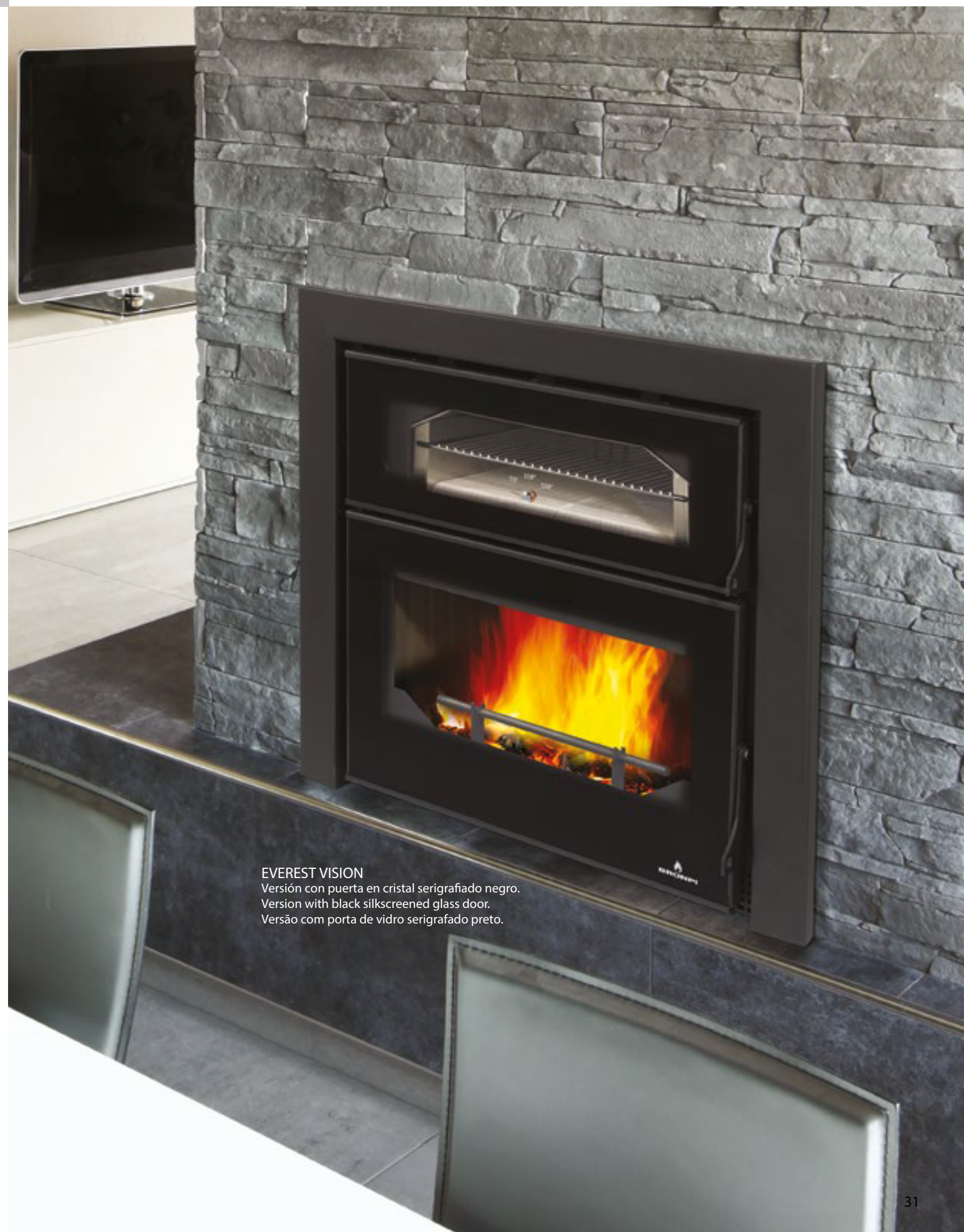
EVEREST VISION Versión con puerta en cristal serigrafado negro. Version with black silkscreened glass door. Versão com porta de vidro serigrafado preto.

Insertable con turbinas, horno Insert with turbines, oven Inserível com turbinas, forno