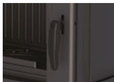
Maneta con acabado siliconado alta resistencia. Handle with high resistance silicone finish. Puxador com acabamento em silicone de alta resistência.