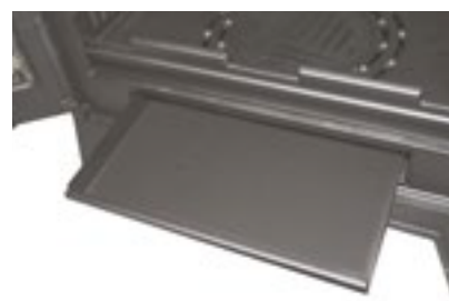
Cajón cenicero extraíble para facilitar la limpieza Removable ash pan for easy cleaning. Gaveta de cinzas extraível para fácil limpeza.